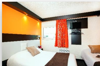
Chambre confort triple