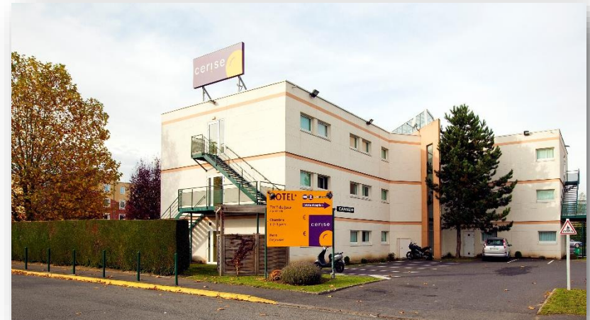
Extérieur CERISE Lens