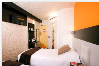
Chambre confort lits jumeaux