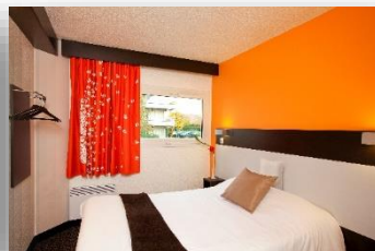
Chambre confort lit double