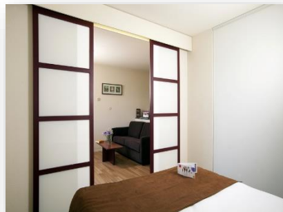
Appartement 4 personnes avec vue piscine