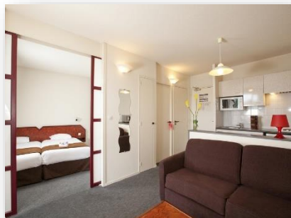
Appartement 4 personnes avec vue forêt

Accès WIFI gratuit / Piscine extérieure / Parking gratuit / Laverie / etc.