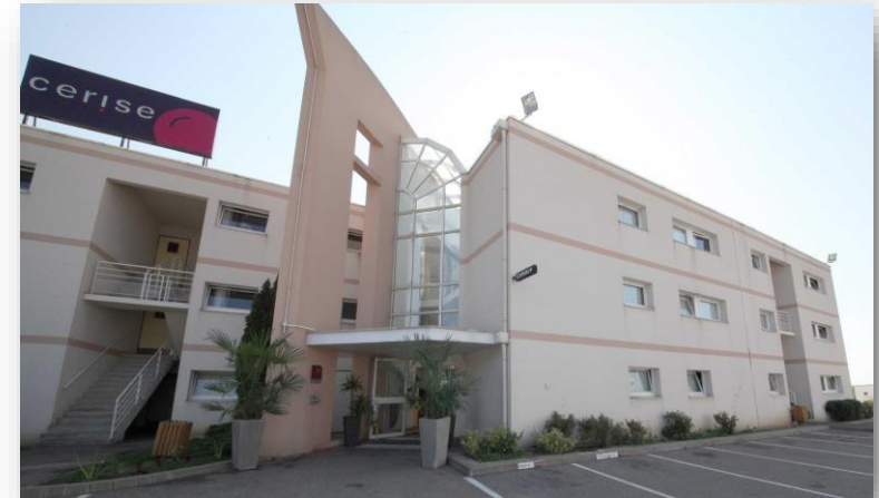
Exterior de CERISE Nancy