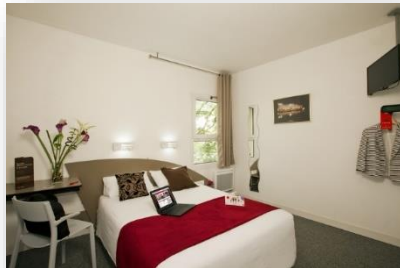
Habitación Confort Doble