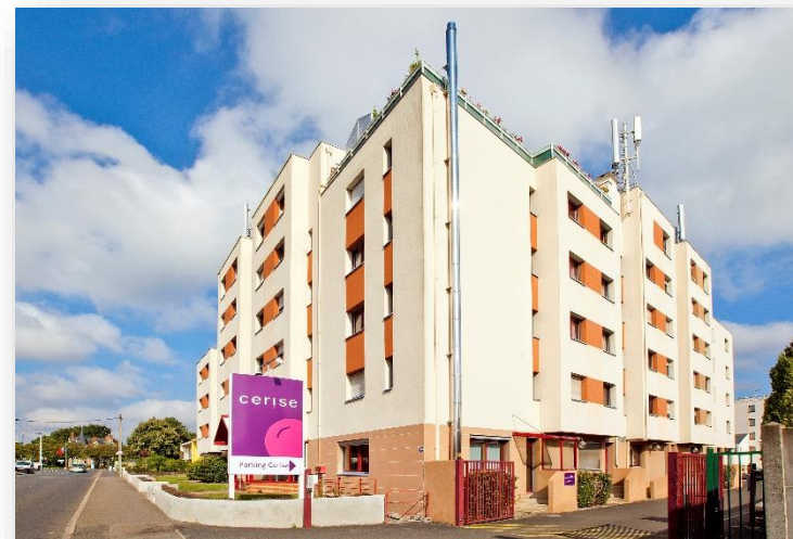
Studio CERISE Nantes la Beaujoire

Profitez de la détente, de la nature et des loisirs au cœur de la résidence CERISE Nantes La Beaujoire.