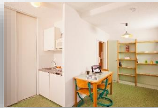
Studio 3 personnes