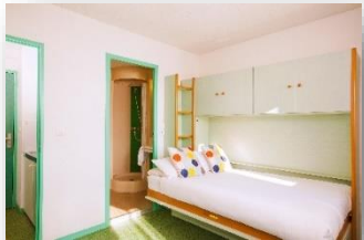
Studio 2 personnes

WIFI gratuit / Parking extérieur gratuit et parking intérieur payant / Laverie / 3 salles de séminaires / etc.