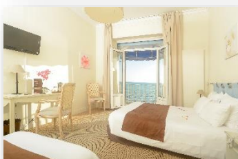
Chambre triple avec vue mer