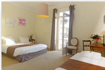
Chambre triple avec vue ville