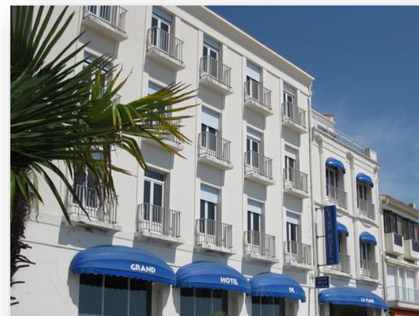
Extérieur Le Grand Hôtel de la Plage

Profitez de la détente, de la nature et des loisirs au cœur de la baie de Pontailiac.