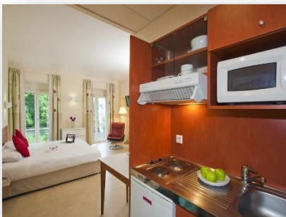
Studio lit double

Ascenseur / Wifi / Parking / Espace verts privatifs / Climatisation / Journaux à disposition / Insonorisation (Double vitrage) / Room service / Blanchisserie etc.