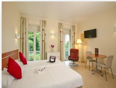
Studio lits jumeaux