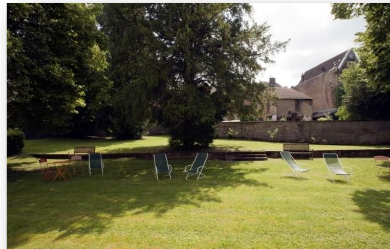
Jardin de la Résidence le Métropole

Profitez de la détente, de la nature et des loisirs au cœur de la résidence le Métropole.