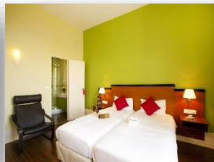
Appartement lits jumeaux