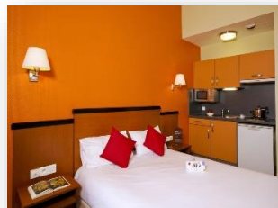
Studio lit double

Ascenseur / Wifi / Parking / Espace verts privatifs / Journaux à disposition / Room service / Blanchisserie etc.