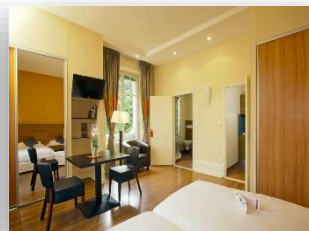
Appartement lits jumeaux avec baignoire