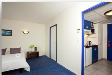
Studio lit double