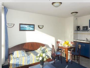
Appartement 4 et 6 personnes