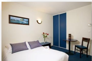
Studio lit simple