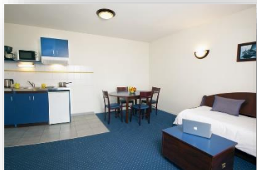
Appartement 4 personnes