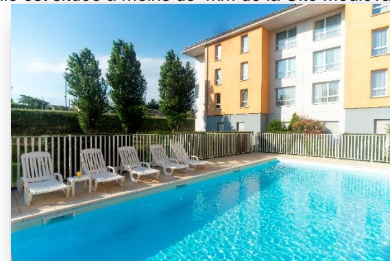
Extérieur CERISE Carcassonne Nord

La résidence est le point de départ pour partir à la découverte du pays Cathare, elle est située à moins de 4km de la Cité Médiévale.