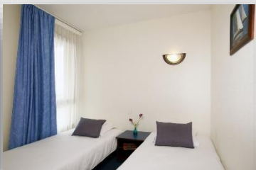
Appartement 6 personnes