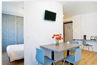
Apartamento dúplex 4 personas