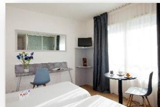
Studio doble (dos camas)