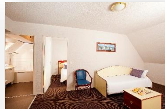
Apartamento dúplex 6 personas