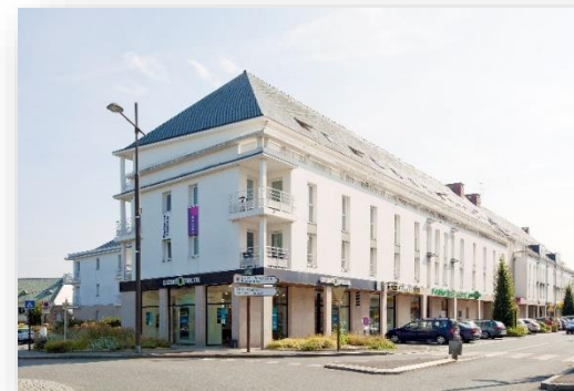
Exterior de CERISE Lannion

¡ La residencia ideal para descubrir los paisajes magníficos de la Costa de Granito Rosa !