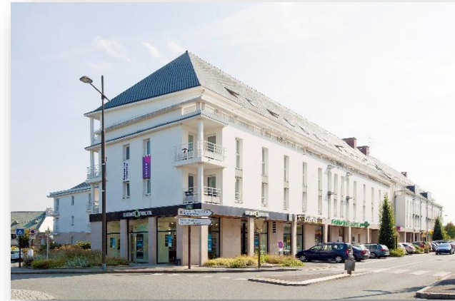
Extérieur CERISE Lannion

La résidence idéale pour découvrir les magnifiques paysages de la Côte de Granit Rose !