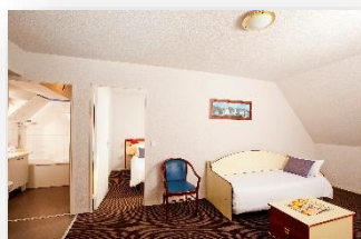
Appartement duplex 6 personnes