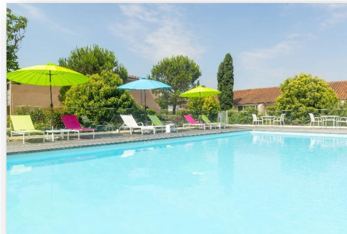
Extérieur de la résidence

La résidence de Diane est une résidence hôtelière de standing équipée d'une piscine extérieure et d'un court de tennis, à 15 min du centre-ville de Toulouse.