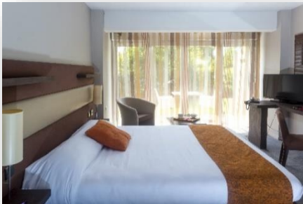
Studio lit double

Accès Internet (Wifi) / Bein Sports / Parking extérieur (gratuit) / Service de blanchisserie (€) / Prêt de matériel de repassage etc.