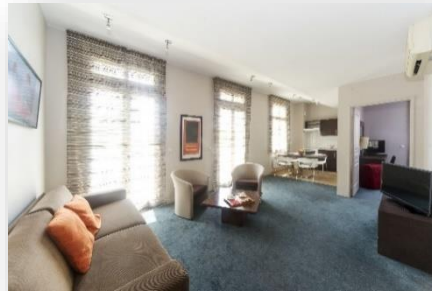
Appartement 4 personnes