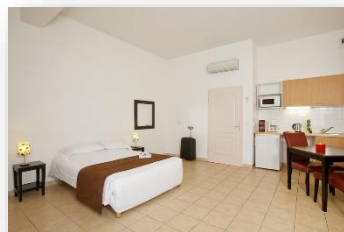
Studio 3 personnes