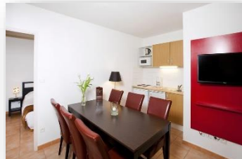
Appartement 6 personnes