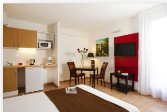
Studio lit double