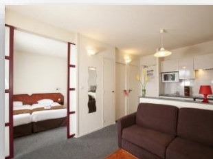
Apartamento 3 personas