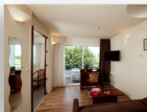
Apartamento 4 personas