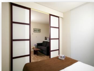
Apartamento 2 personas

Accès WIFI gratuit / Piscine extérieure / Parking gratuit / Laverie / etc.