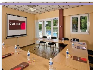
Salle de réunion

La résidence Les Jardins du Lac met à votre disposition une salle de séminaire, avec une capacité de 35 personnes.