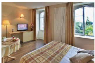
Studio 2 personnes

Ascenseur / Wifi / Parking public / Terrasse / Journaux à disposition / Blanchisserie / Bibliothèque etc.