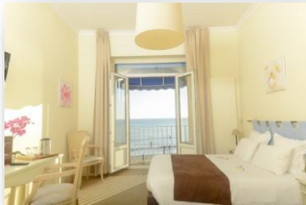
Habitación 2 personas con vista al Mar