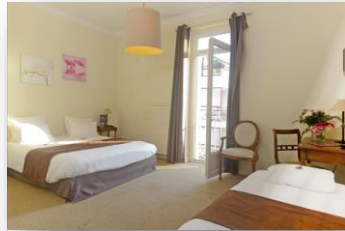
Habitación 3 personas con vista a la ciudad