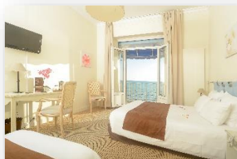
Habitación 3 personas con vista al Mar