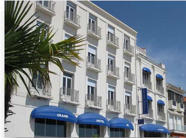
Exterior de Le Grand Hôtel de la Plage

Saque provecho del descanso, de la naturaleza y del ocio en el corazón de Pontailiac.