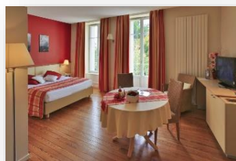
Estudio 4 personas