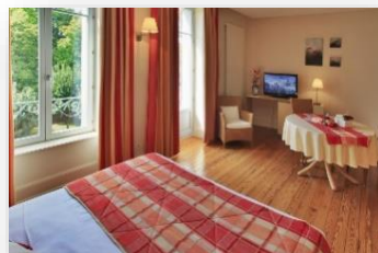
Estudio 2 personas