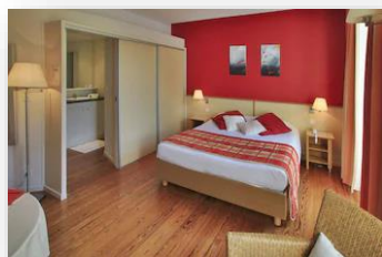
Estudio 3 personas