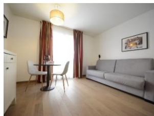
Apartamento 4 personas