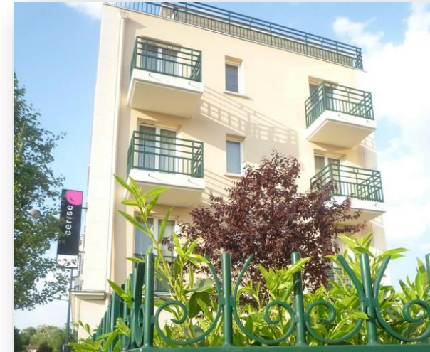
Exterior de CERISE Chatou