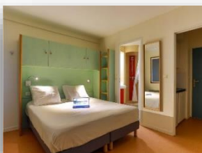
Studio 2 personas