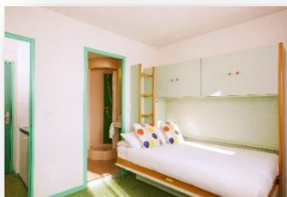
Studio 1 persona

WIFI gratuito / Aparcamiento exterior gratuito y aparcamiento interior de pago / Lavandería / 3 salas de seminarios / etc.