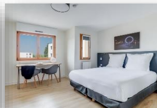
Studio Superior 2 personas