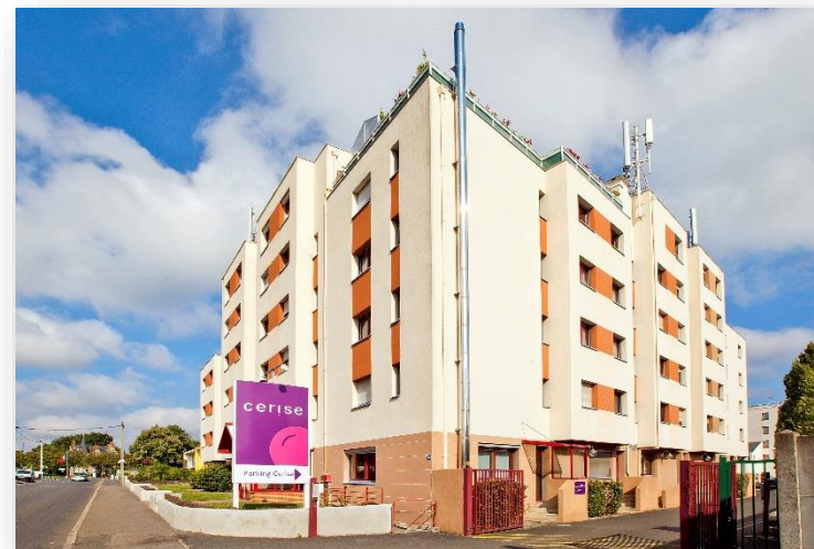
CERISE Nantes la Beaujoire

Saque provecho del descanso, de la naturaleza y del ocio en el corazón de la residencia CERISE Nantes La Beaujoire.