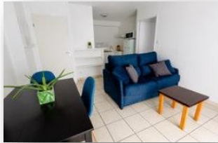
Appartamento 4 personas