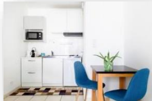
Studio 3 personas