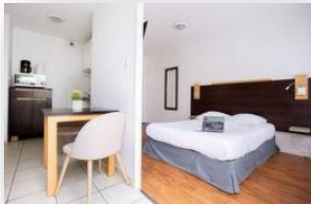
Studio 2 personas

Wifi gratuito / Aparcamiento gratuito / Lavandería / etc.