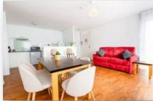
Appartamento 6 personas